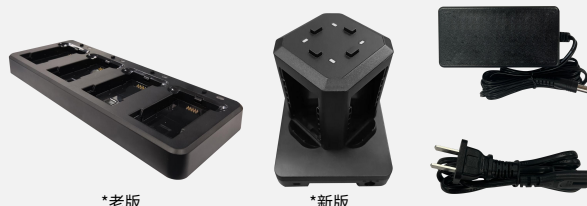
*老版 *新版 CHA-CRD4B-K8 1.0/2.0